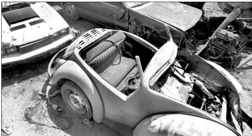
INTERNET Y CARLOS RAMOS MAMAHUA

Primero, el prototipo bosquejado por Adolfo Hitler; en seguida el modelo 1938, cuando el Sedán cumplía su segundo año de existencia, y al final vocho de los años 90 en un corralón