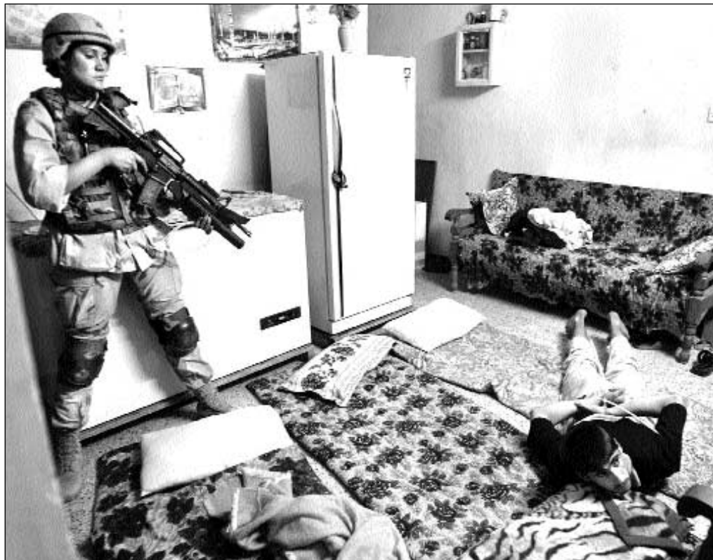
Operación de tropas estadounidenses en viviendas de Tikrit en busca de presuntos guerrilleros iraquíes. En la incursión fueron detenidas 12 personas

Los nuevos guardias iraquíes de la prisión de Abu Ghraib han sido capacitados en derechos humanos, incluidos dos que resultaron