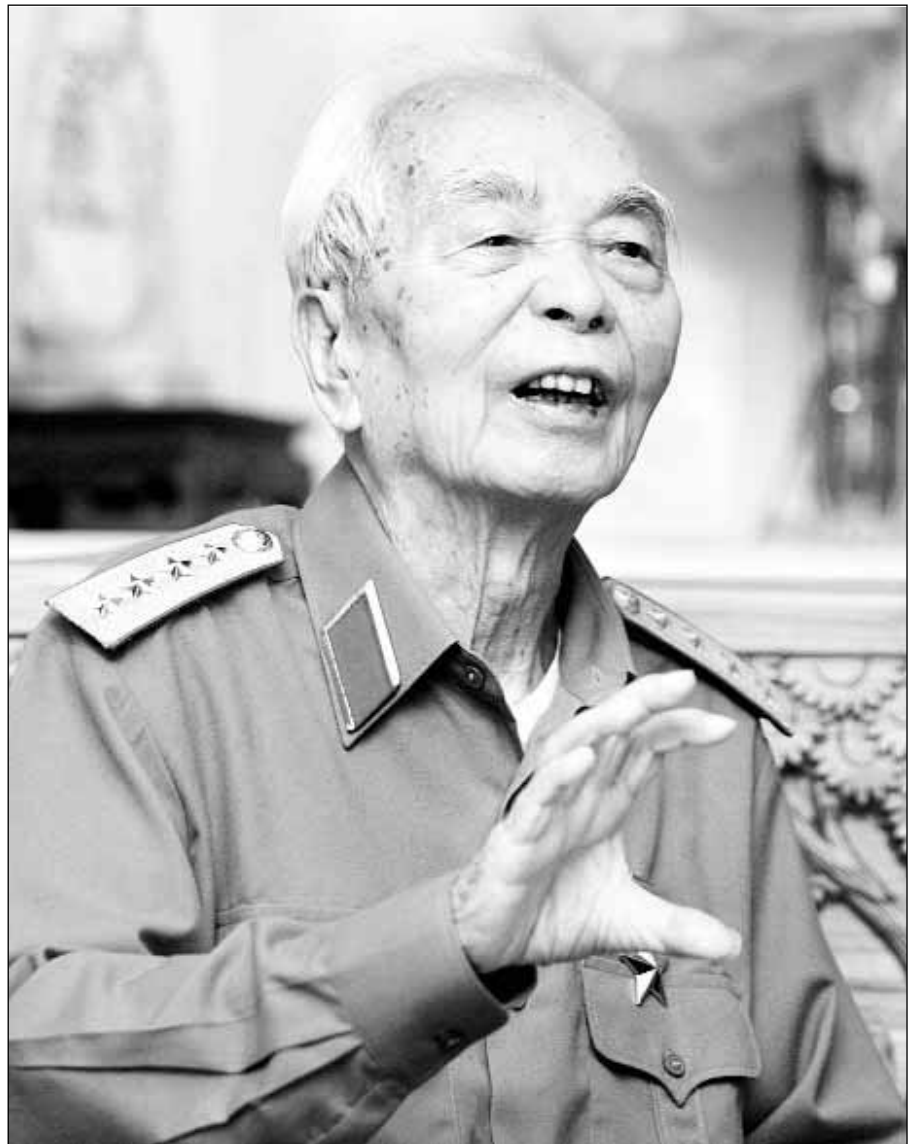
El legendario general vietnamita Vo Nguyen Giap, de 93 años, en imagen del jueves pasado

Una conferencia sobre Indochina, celebrada en julio de 1954, decidió dividir el país en dos estados independientes, separados por el paralelo 17, cada uno de los cuales se convirtió en