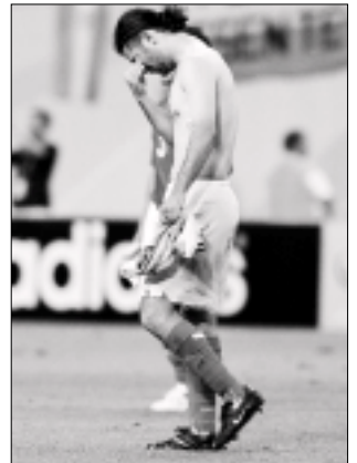
Rafa Márquez: “El equipo siempre fue al frente, pero desgraciadamente eso no bastó otra vez”