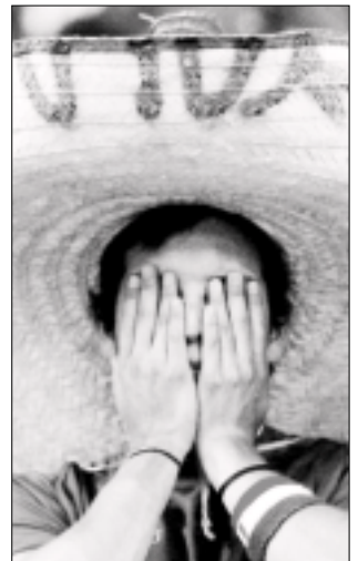
En el Zócalo: Los aficionados mexicanos, que se congregaron por miles, probaron de nuevo el sabor de la derrota