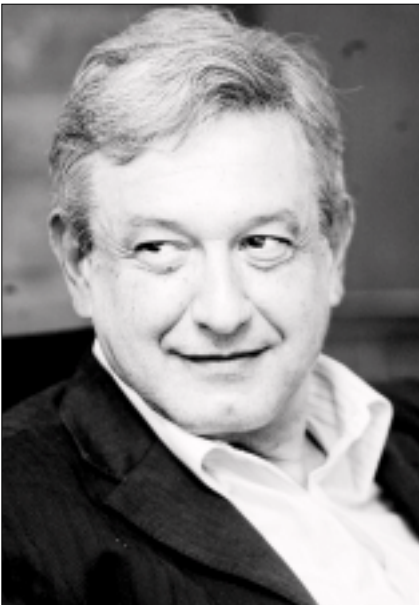
Andrés Manuel López Obrador, candidato presidencial de la coalición Por el Bien de Todos ■ Carlos Cisneros