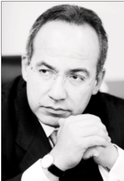
Felipe Calderón Hinojosa, candidato presidencial del Partido Acción Nacional