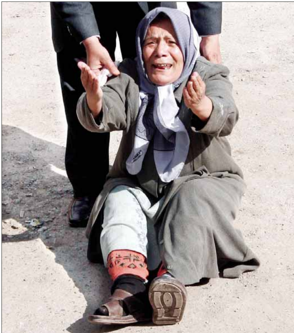
Desolación de una anciana iraquí luego de que uno de sus parientes fue herido al estallar uno de dos coches bomba en Kirkuk; 12 personas perecieron. El presidente estadounidense George W. Bush dijo que el plan de seguridad para Bagdad tardará “meses, no días,” en dar resultados. Se informó también que el ex vicepresidente Taha Yassin Ramada fue ejecutado

Tan peligroso es viajar en cualquier lugar de Irak fuera del Kurdistán, que los periodistas tienen dificultades para reunir pruebas de la carnicería que se desarrolla en la nación sin exponerse a morir ellos mismos. Durante mucho tiempo, Blair y Bush han dado a entender que la violencia se limita al centro de Irak.