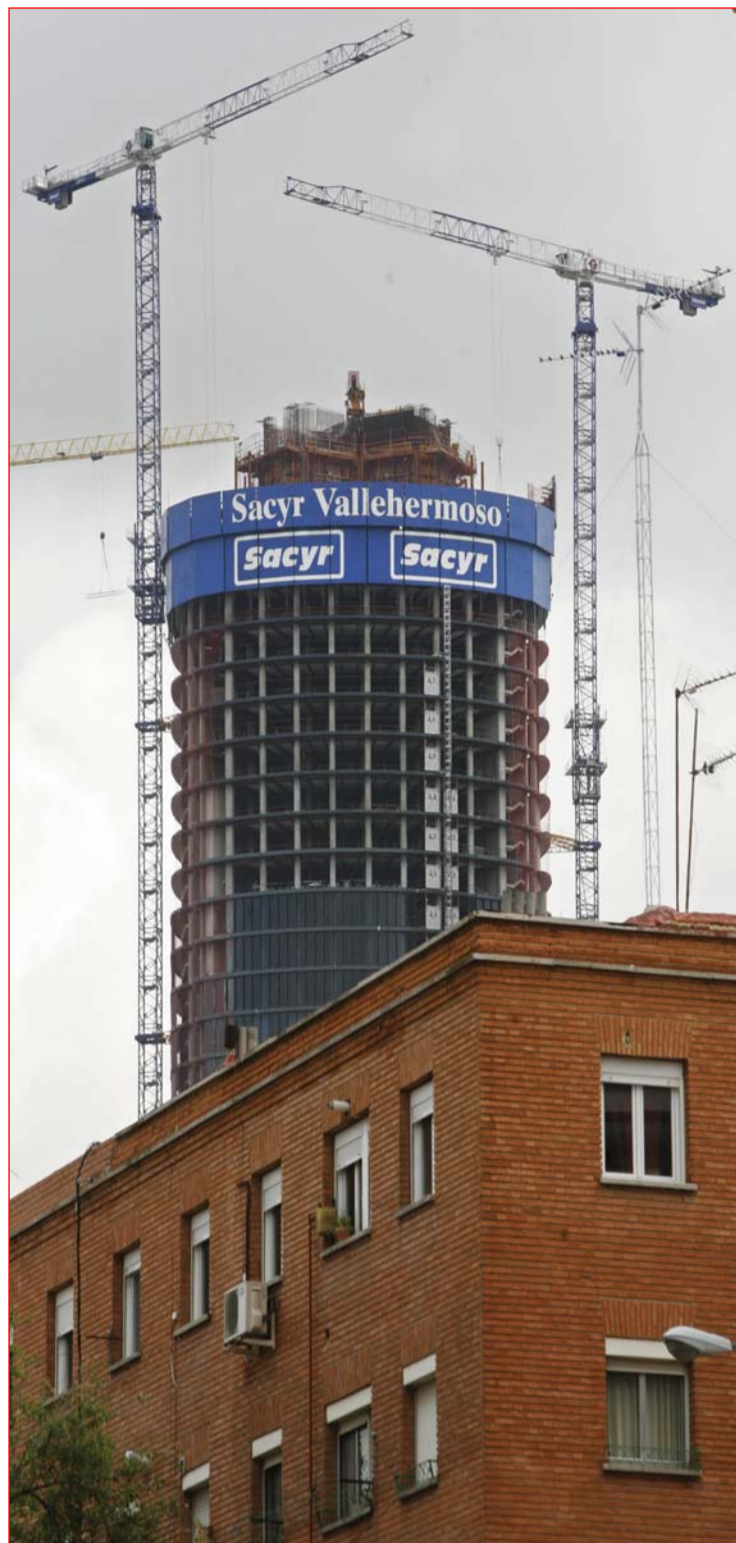
Los bienes raíces en España siguen al alza, pero a menor ritmo

El otro factor clave fue la competencia. A finales de los setentas España abrió sus puertas a los bancos extranjeros, lo que obligó a las firmas locales a afi-