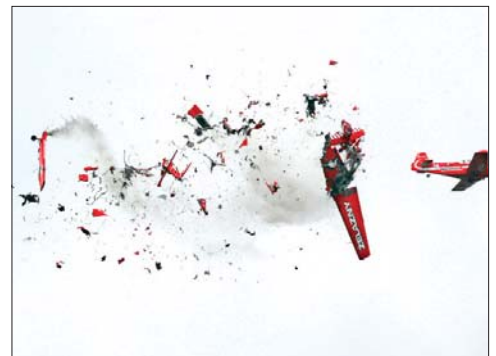
Dos avionetas del equipo Zelazny chocaron durante una exhibición ante cientos de espectadores en el aeropuerto Radom, a unos 100 kilómetros de Varsovia. Dos pilotos perecieron y uno más evitó milagrosamente la colisión. En tierra, nadie resultó herido