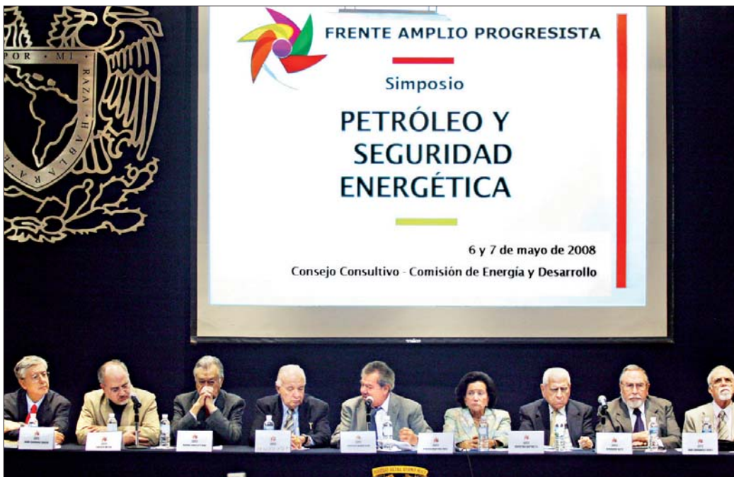
El FAP organizó el encuentro Petróleo y Seguridad Energética en el auditorio de la antigua Escuela de Medicina de la UNAM. Entre los ponentes estuvieron Jaime Cárdenas, Lorenzo Meyer, Manuel Bartlett, José Agustín Ortiz Pinchetti, Porfirio Muñoz Ledo, Ifigenia Martínez, Juventino Castro, Bernardo Bátiz y Raúl Carrancá y Rivas

Nuevo jalón de petroprecios ; el crudo mexicano, en 102 dólares