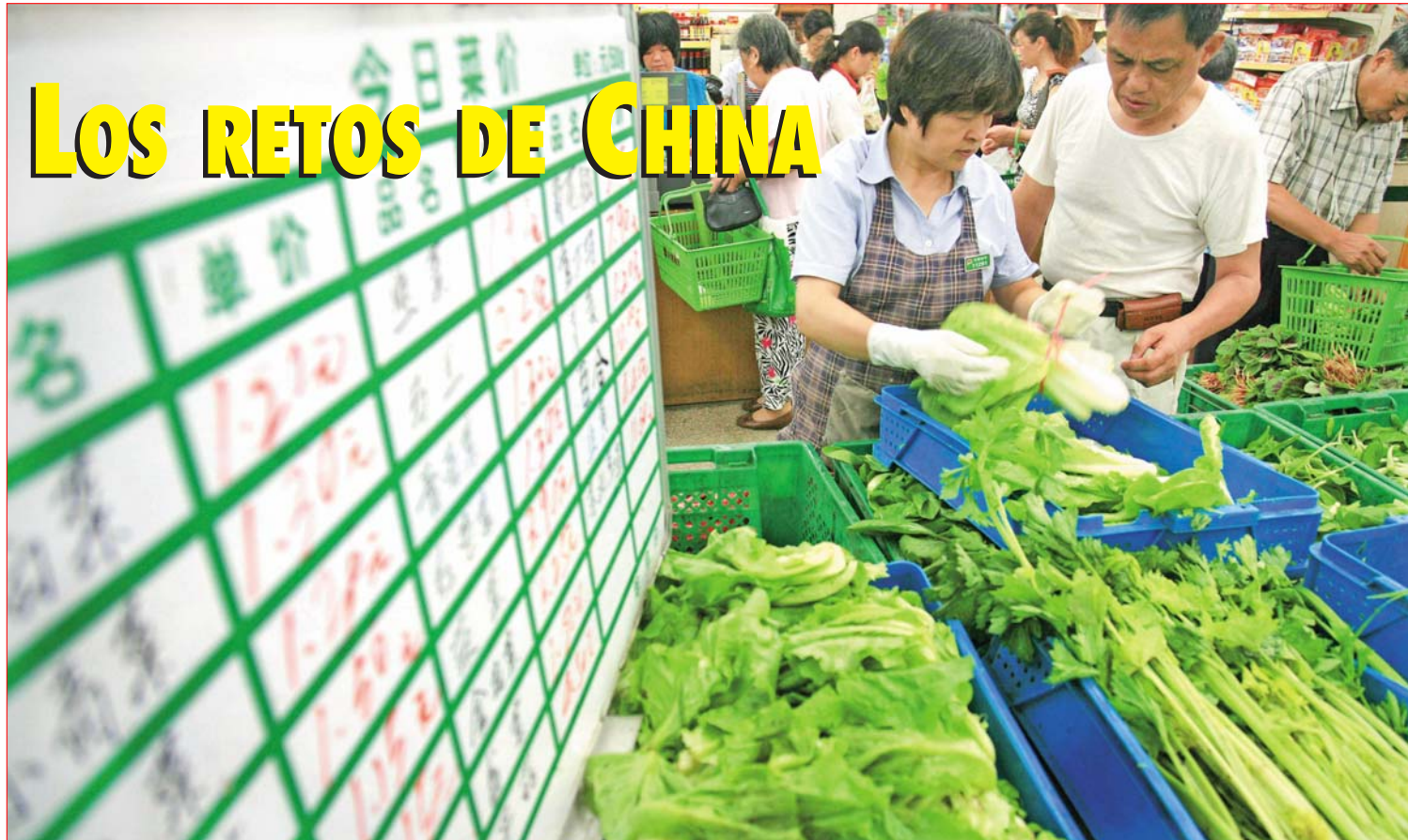
Para la economía china es inevitable el descenso en el ritmo de crecimiento, pero afortunadamente la inflación aún no está fuera de control

Para compensar, el partido tendrá que realizar cambios radicales. En estos días se esfuerza por llevar