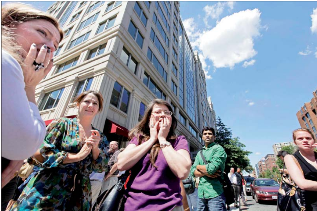
Miles de personas desalojaron sus edificios en Washington por el inusual sismo. El movimiento telúrico tuvo una duración entre 20 y 30 segundos y provocó que se rompieran los tres pináculos de la torre central de la Catedral Nacional. El presidente Barack Obama convocó a los principales responsables en materia de seguridad nacional y de evaluación de desastres para analizar el impacto del temblor

■ Afecta a 25 millones de personas desde Carolina del Norte a Ontario; paran 2 reactores atómicos