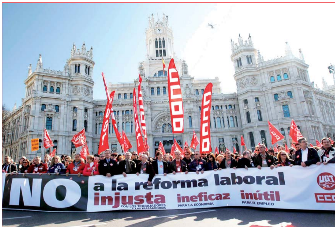
Manifestación el domingo pasado en el centro de Madrid contra los planes del gobierno español de restringir las prestaciones laborales

Es probable que la zona euro se haya precipitado en la recesión en el cuarto trimestre de 2011, y continuamos pronosticando una contracción de 1.2% en 2012. La presión sobre las deudas soberanas de la región sigue siendo intensa, aunque los rendimientos de los bonos han bajado un poco. Los líderes mantienen su postura de que la austeridad es la ruta para salir de la crisis, pero en el camino hacia la virtud financiera existe el riesgo de que las políticas se