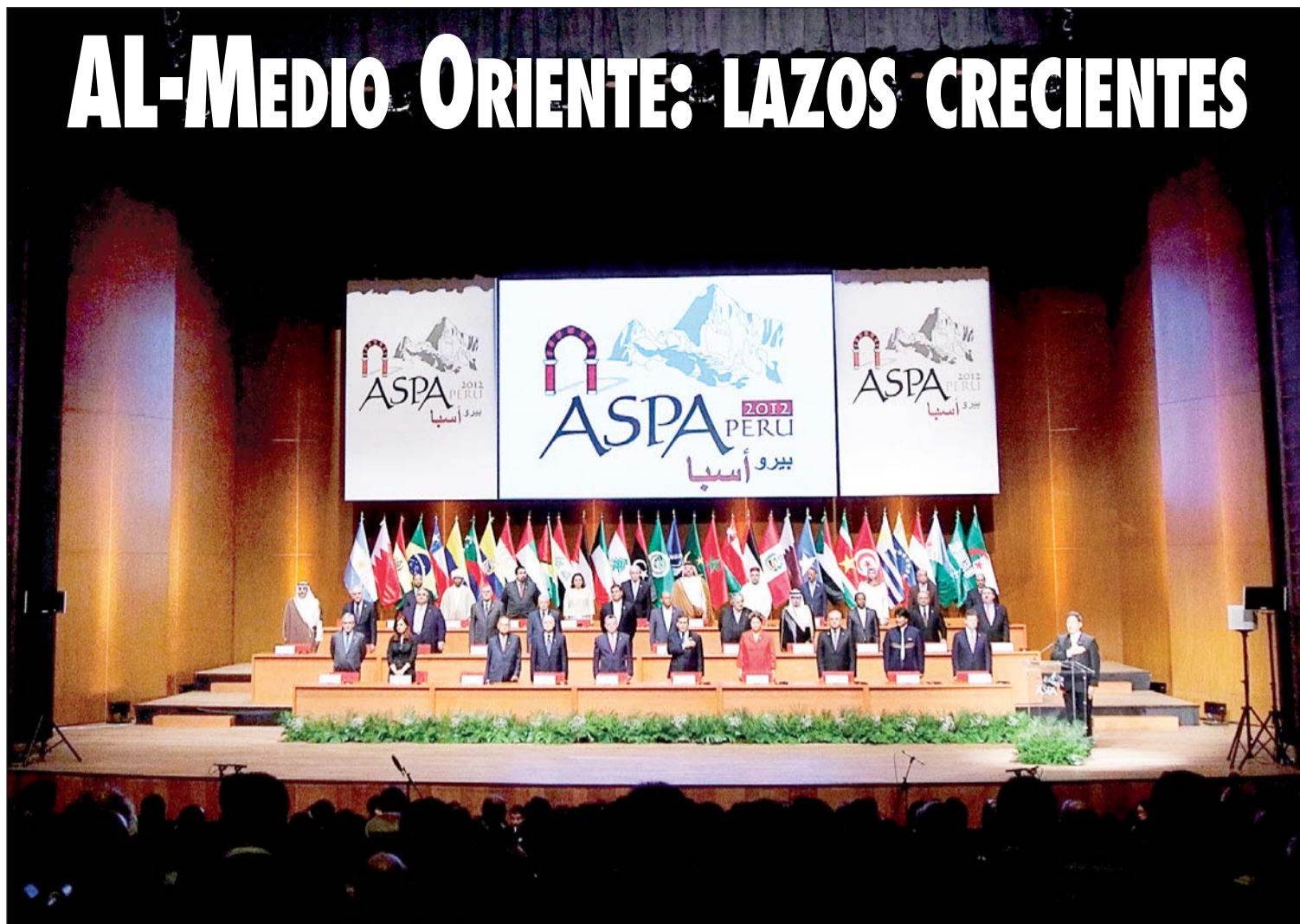
Inauguración de la tercera cumbre de jefes de Estado y gobierno de naciones sudamericanas y árabes (ASPA), celebrada en Lima, Perú a comienzos de octubre pasado

Aparte de la cumbre de ASPA, líderes árabes han emprendido una ofensiva para enamorar a