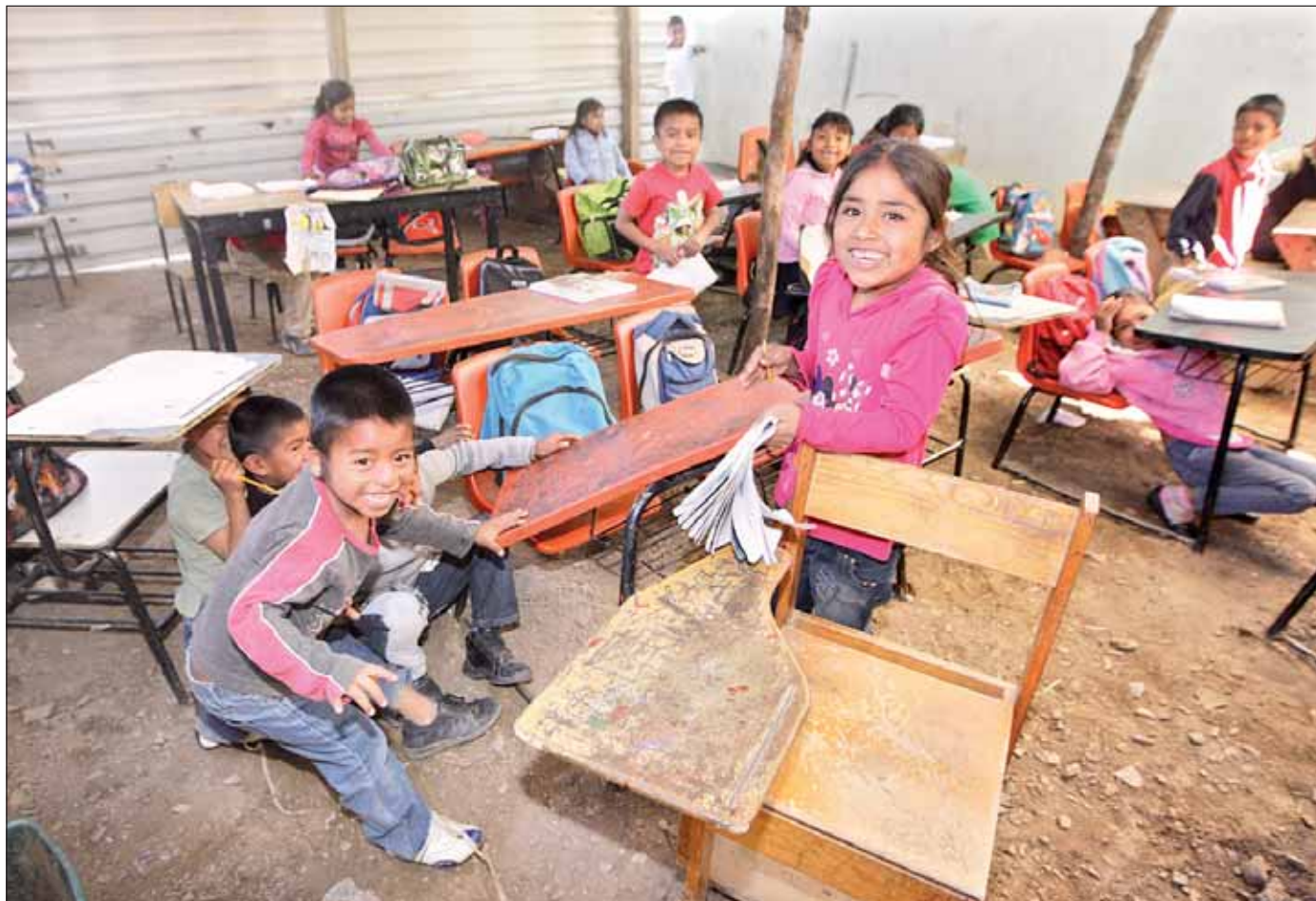
Mañana, al iniciarse el ciclo 2014-2015, miles de niños recibirán clases en escuelas con piso de tierra, sin agua ni luz. Se contemplan 200 días de clases, las cuales concluirán el 14 de julio del año próximo. Además de los educandos, retomarán sus labores un millón 200 mil profesores en 229 mil planteles públicos y privados. En la imagen, aula en Zahuatlán, Oaxaca