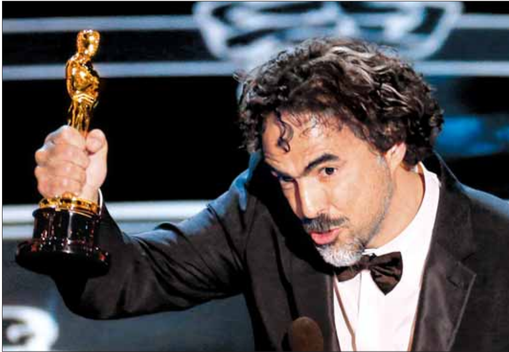
"Quizás el año que entra el gobierno (de Estados Unidos) le pondrá reglas a la inmigración en la academia... dos mexicanos, eso es sospechoso...", expresó irónico el cineasta Alejandro González Iñárritu al recibir el Óscar para Birdman por mejor película

Ruego por que en mi país encontremos el gobierno que nos merecemos, dice el cineasta