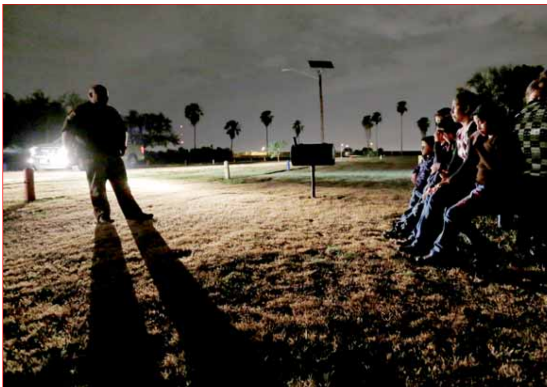
Un grupo de inmigrantes centroamericanos que cruzaron la frontera con Estados Unidos hacen una parada en Granjeno, Texas. En la reciente Cumbre en Panamá, Barack Obama reiteró su objetivo de gastar mil millones de dólares el año próximo para atender las causas de la inmigración procedente de Guatemala, El Salvador y Honduras, región conocida como Triángulo Norte

En la reciente Cumbre en Panamá, el 10 y 11 de abril, Barack Obama reiteró su objetivo general de gastar mil millones de dólares el año próximo para atender las causas de la inmigración procedente de Guatemala, El Salvador y Honduras, región conocida como Triángulo Norte. Expertos opinan que su propuesta, combinada con esfuerzos conjuntos de los tres países por detener a los jóvenes que pretenden emigrar,