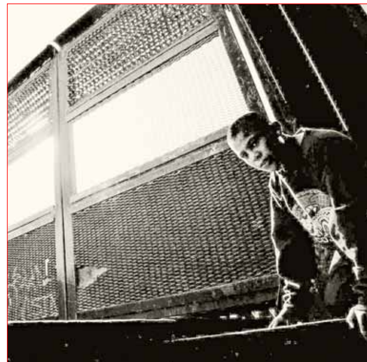
En Ciudad Juárez un joven busca pasar por el llamado “puente negro” hacia el lado estadounidense

Fuentes: Servicio de Aduanas y Protección Fronteriza de EU; Oficina de América Latina en Washington (WOLA) Menores de 17 años Pronóstico*