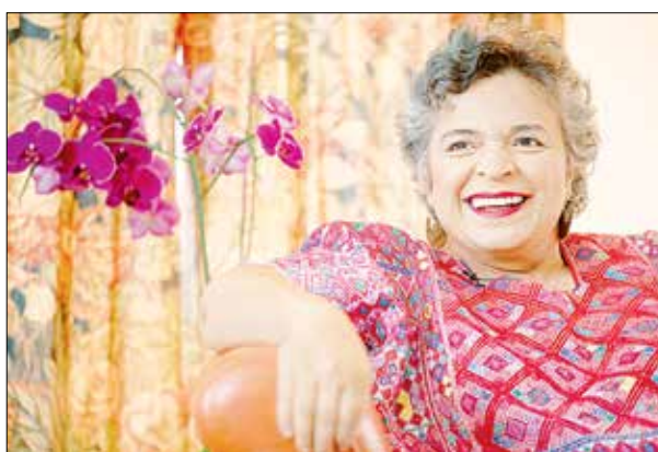
▲ La ex dirigente del PRI aspira a contender por la Presidencia en 2024.