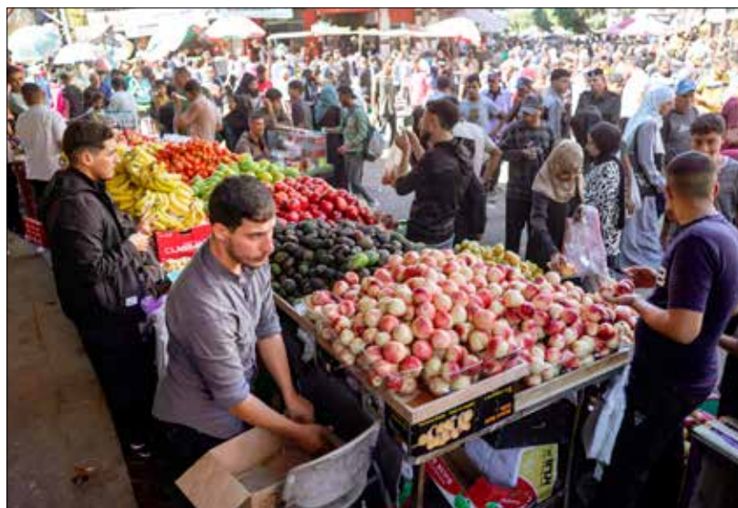
▲ Israel asesinó al menos a 38 palestinos en Gaza desde la entrada en vigor del acuerdo de paz, el 10 de octubre, mientras más de 280 cuerpos fueron rescatados de entre los escombros. En un intento por recobrar la normalidad, en Deir al-Balah se instaló un mercado. Foto Afp AGENCIAS/P 17 Y 18